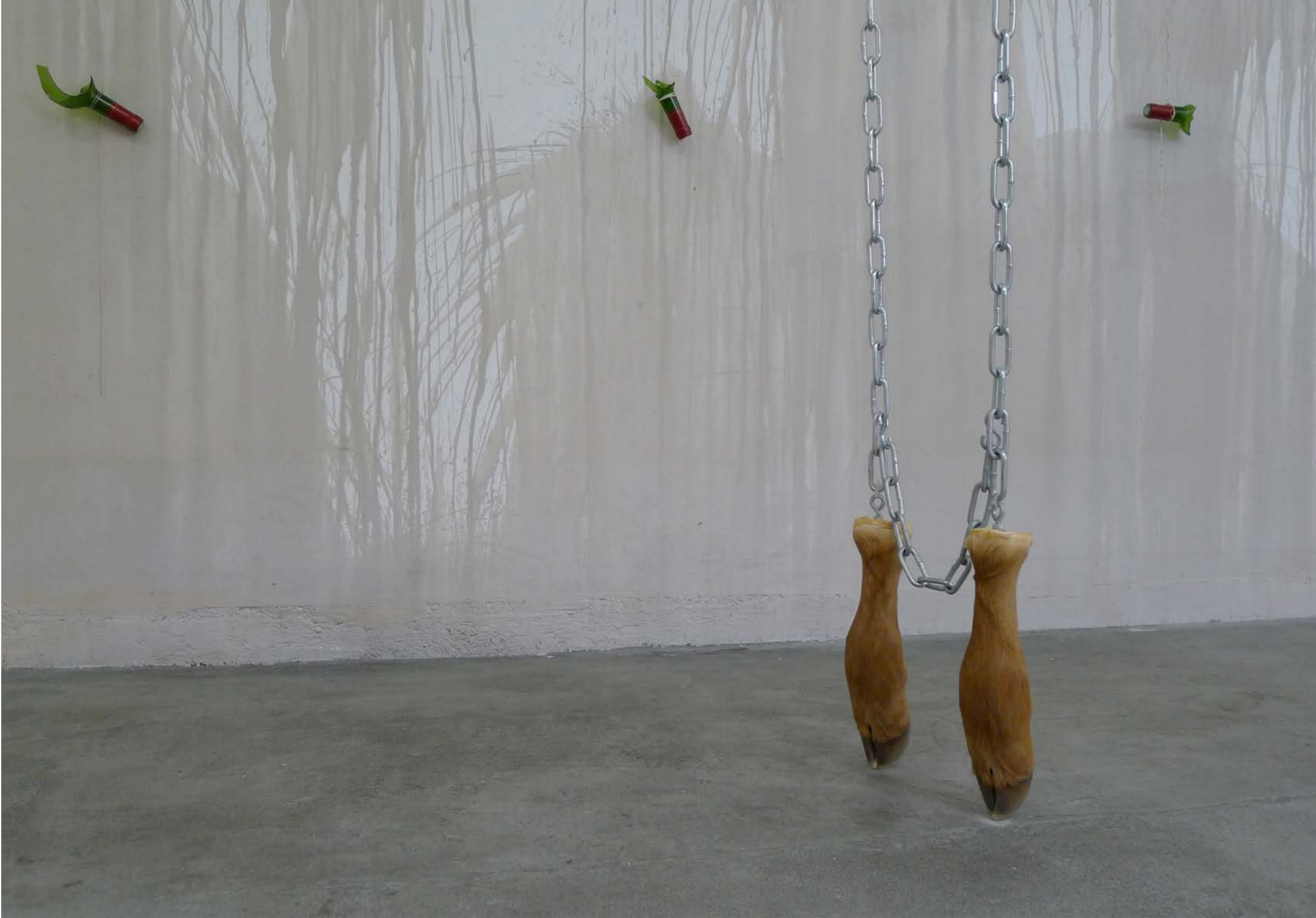
Taxidermie, 2016, Foto: Delphine Reist

Søren Kirkegaard aveva invece una visione più positiva. „È proprio vero quel che dicono i filosofi: la vita va compresa all'indietro. Ma non bisogna dimenticare l'altro principio, che si vive in avanti“. Il medesimo concetto è ripreso anche dal titolo di una delle prossime retrospettive proposte dal programma Binding Sélection d'Artistes, denominata in maniera calzante „Zwischen Halt Neubeginn“ era dedicata a Velimir Ilišević (dal 24 settembre 2016 fino a 12 febbraio 2017 al Museum zu Allerheiligen di Sciaffusa).