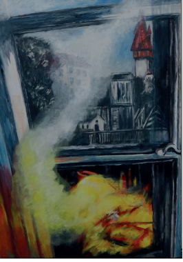
Licht und Nebel