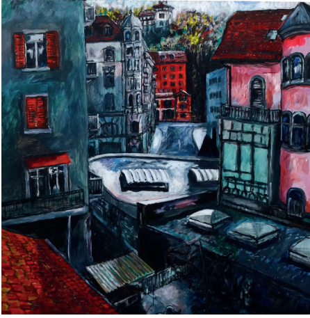
Blick zum Hof 2