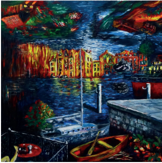
Hydro, Fire, Wind & Cities