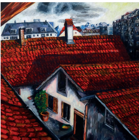
Blick zum Hof 1